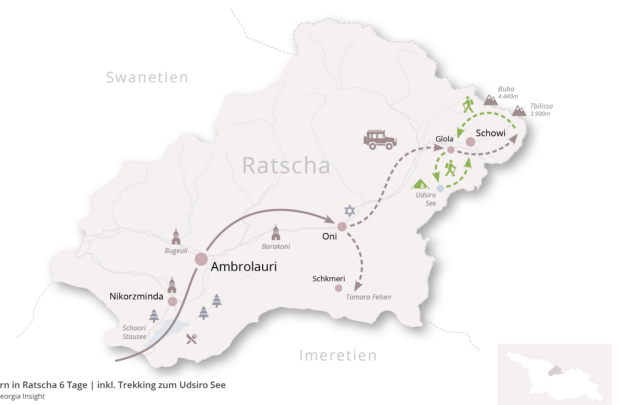
Wandern in Ratscha 6 Tage | inkl. Trekking zum Udsiro See © 2025 Georgia Insight